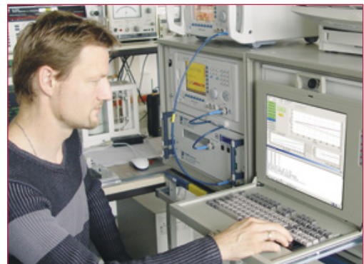
通过对我们国际认证实验室中的ATE校准系统进行验证, 我们保证最高的精确度